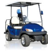
GOLFWAGENTJES DIE NIET OP DE OPENABRE WEG MOGEN GOLFETTES NON HOMOLOGABLES SUR ROUTE