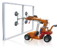
TRUCKS MET ZUIGNAPPEN CHARIOT À VENTOUSES