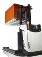
ELEKTRISCHE PALLETSTAPELAARS AUTOMATISCHE GERBEUR ÉLECTRIQUE AUTOMATIQUE