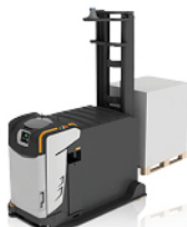
ELEKTRISCHE PALLETSTAPELAARS MET CONTRAGEWICHT AUTOMATISCHE GERBEUR À CONTREPOIDS ÉLECTRIQUE AUTOMATIQUE