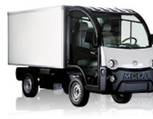
ELEKTRISCHE VOERTUIGEN VÉHICULES ÉLECTRIQUES