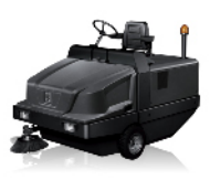
SCHROB- EN VEEGMACHINES BALAYEUSES AUTO-LAVEUSES