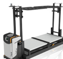
ELEKTRISCHE PALLETSTAPELAARS MET TRANSPORTBAND AUTOMATISCHE GERBEUR CONVOYEUR ÉLECTRIQUE AUTOMATIQUE