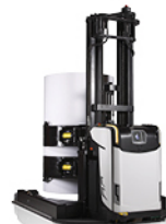
ELEKTRISCHE TRUCKS VOOR HET VERVOEREN VAN ROLLEN AUTOMATISCHE PORTE BOBINE ÉLECTRIQUE AUTOMATIQUE