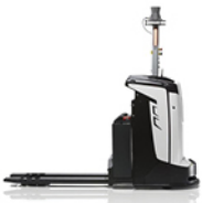
ELEKTRISCHE PALLETWAGENS AUTOMATISCHE TRANSPALETTE ÉLECTRIQUE AUTOMATIQUE